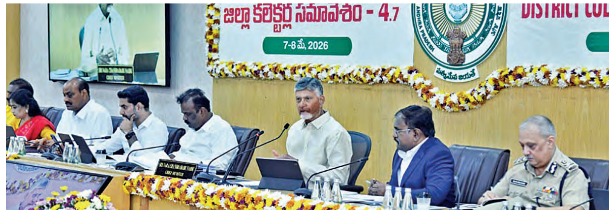
గురువారం సచివాలయంలో బిజినెస్ కలెక్టర్ల సమావేశంలో పాల్గొన్న సిఎం చంద్రబాబు, మంత్రులు అచ్చెన్నాయుడు, లోకేశ్ తదితరులు

బిజినెస్ లిఫార్టర్ పురస్కారం మన సమష్టి కృషికి నిదర్శనం విశాఖ స్టీల్ ప్లాంట్ కు రూ. 11,440 కోట్లు కేంద్ర సాయం 100 సంక్షేమ పథకాలు నూరుశాతం అమలు కలెక్టర్ల సమావేశంలో వివరించిన సిఎం చంద్రబాబు